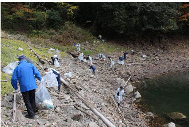
ダム湖内の流木等を回収