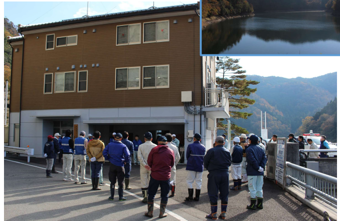
C L T パネル工法で建てた管理所前に集合